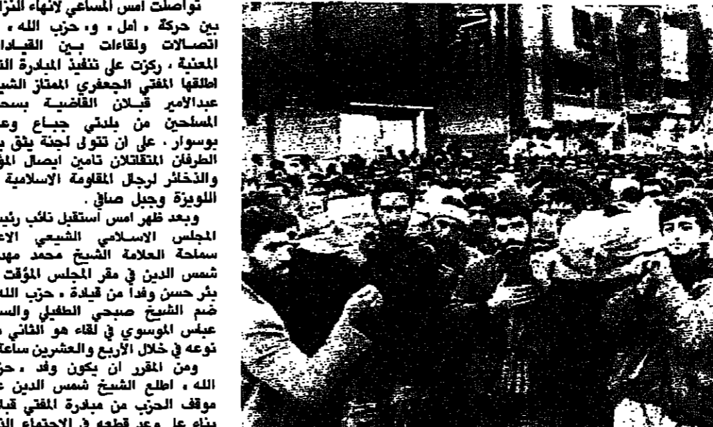
انصر حزب الله يشيعون قتلاهم في الضاحية